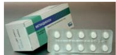
Hier noch einmal aus einem anderen Winkel