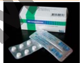
Russisches Metandienon besitzt den Ruf, besonders stark zu wirken. In einer älteren Publikation wurde gemutmaßt, dass bei der Herstellung der Tabletten ein chemischer Vorgang nicht korrekt durchgeführt wurde und demnach eine gewisse Menge Methyltestosteron in den Tabletten enthalten sei. Ob dies so war, bleibt dahingestellt. Fakt ist jedoch, dass die Qualitätsstandards heutzutage so hoch sind, dass solche Fehler als unwahrscheinlich anzusehen sind. Es liegt wohl eher nahe, dass auf Grund des billigen Preises eine höhere Dosierung gewählt wurde. Metandienon, oder Methandrostenolon, wird in Russland von zwei Firmen hergestellt. Zum einen von Bioreactor und zum anderen von der Firma Akrikhin, die erst kürzlich die Produktion wieder aufnahm. Hier sehen wir die aktuelle Version der Firma Bioreactor. Pro Packung sind zehn Durchdrückstreffen à 10 Tabletten enthalten. Die Tabletten weisen keinerlei Besonderheiten auf, sondern sind schlicht weiß.