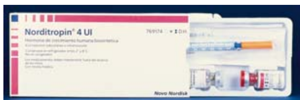
Echtes Norditropin aus Spanien